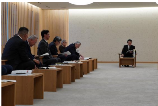
要望を行うコンソーシアム関係者（左側） と知事（中央）