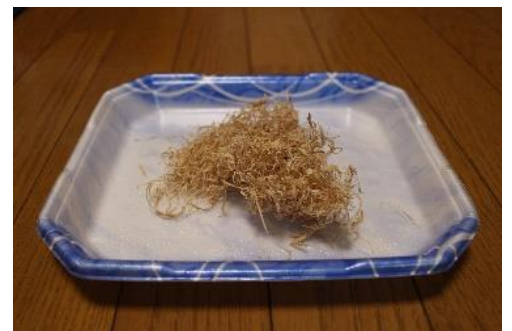
広葉樹混合カンナ屑