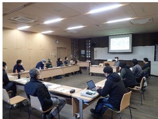
INN THE PARK 矢部氏による講義