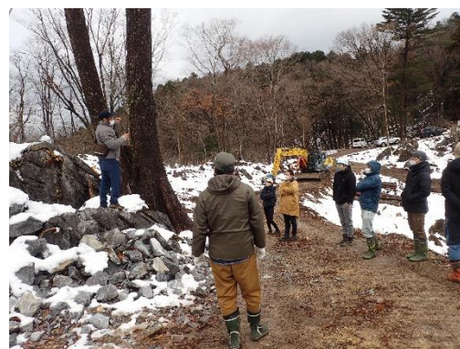
ツリーハウス用の立木の選定方法の説明