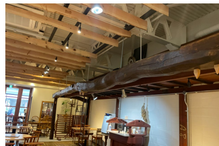
写真：内装材として利用される梁

古材を扱う販売業者によると、販売されている古材（梁・桁・板）は店舗などの内装材として利用されるという。軸材としての需要はほとんどなく、経年変化で色褪せた風合いや、ちょうなやホゾ穴などの大工技術が意匠的な魅力となり、需要となっている。