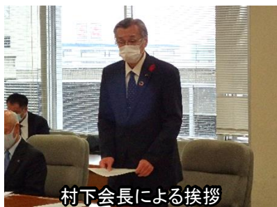
村下会長による挨拶