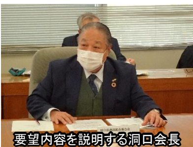
要望内容を説明する洞口会長