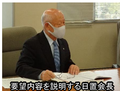
要望内容を説明する日置会長