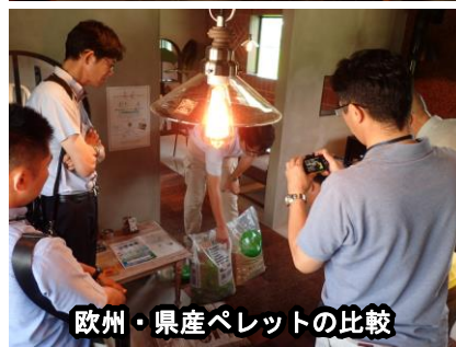
欧州・県産ペレットの比較