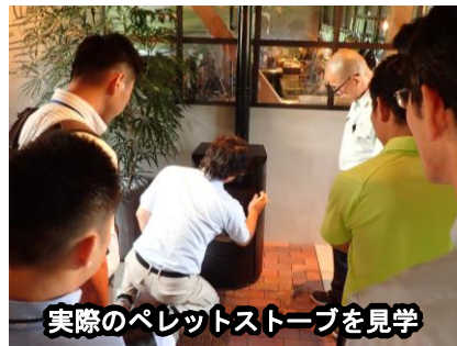
実際のペレットストーブを見学