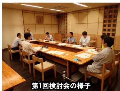
第1回検討会の様子

来たる9月22日～29日に行うドイツ林業先進地調査2019では、第1回・第2回検討会で洗い出された課題・疑問の解決のためロッテンブルク林業大学の教授とのレクチャーや、ペレット・ペレットストーブの工場等を訪問する予定としています。林業先進地調査後に行う第3回検討会では、ドイツより持ち帰った情報を共有し、実際のペレット・ペレットストーブの品質向上へつなげる取り組みを展開していく予定です。