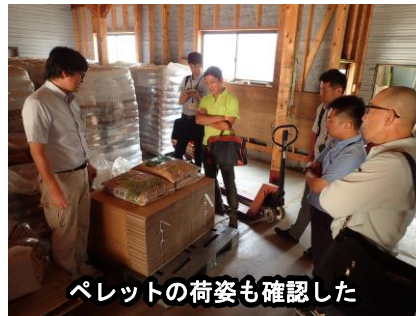
ペレットの荷姿も確認した