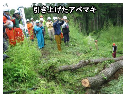
引き上げたアベマキ