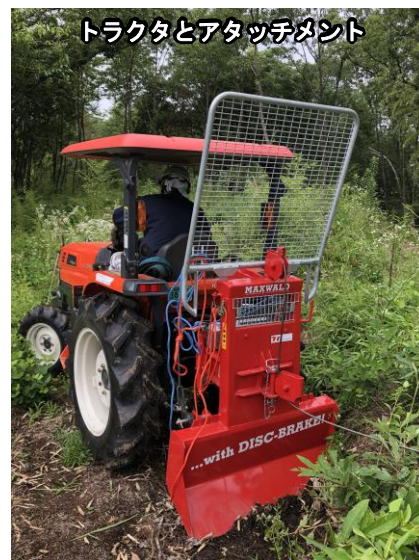
トラクタとアタッチメント

今後は、引き続き美濃加茂市内の里山林を中心にどのような活用ができるのかを試し、その結果をまとめ、農家が保有しているトラクタを、普段は農業に、農閑期は里山林にと、1年を通じて活用できる方法を提案する予定です。貸し出しも行う予定ですので、興味を持たれた方は事務局までご連絡ください。