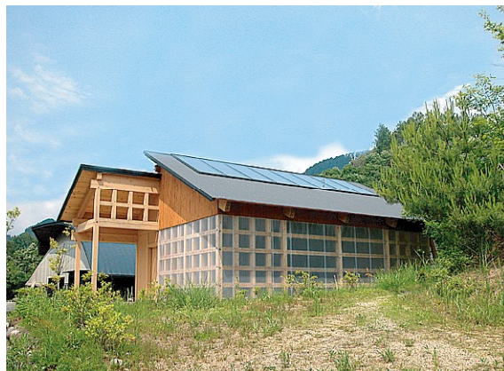
活木処 南西より見る