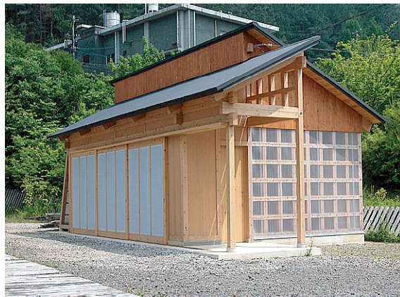
活木処 北西より見る

[2]木材流通の把握 使用された木材は、アカデミー学生によって製材、乾燥、品質管理(含水率など)が行なわれた。原木の出所まで100%の流通を把握し、その材が建物のどこに使われているか追跡している。国産材率は90%、構造耐力を取るために使用した構造用合板の割合が10%で輸入されたものだった。使用した総材積は12.54m 3 である。 また、工事途中に追加した原木は、その時期の岐阜県産の木材市場に出てくる原木の割合に即して購入した。我々が求める等級、量の木材の需要と山側から出される木材供給の関係を意識したものである。