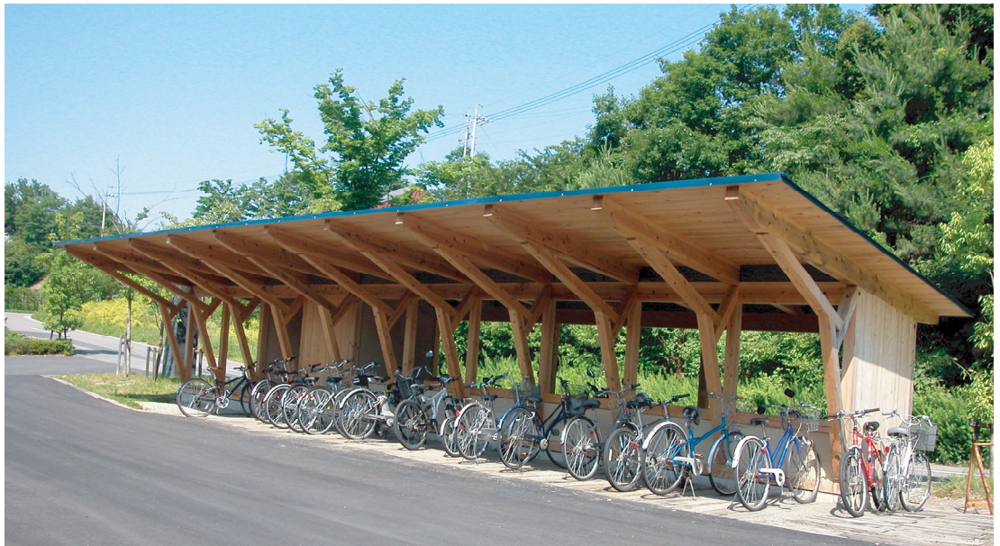
switch 外観 (アトリエより見る)